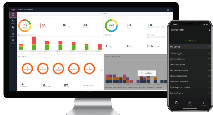
Console de gerenciamento do Harmony Mobile